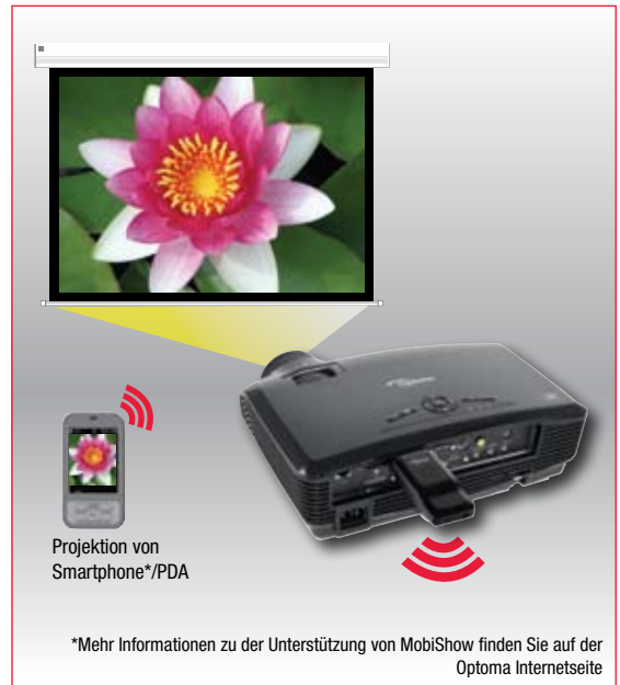
Wireless Projektion über Smartphone