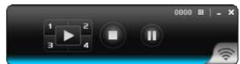
Benutzeroberfläche der WPS2-Software