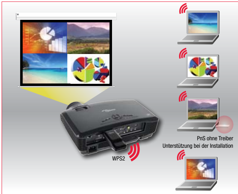
Wireless Projektion mit vier Notebooks